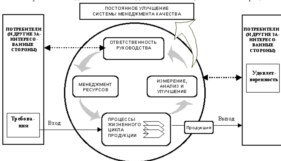
Рисунок 1 – Модель системы менеджмента качества, основанной на процессном подходе

Модель системы, приведенная на рисунке 1, охватывает все требования стандарта ИСО 9001 (разделы 5-8), но не показывает процессы на детальном уровне.